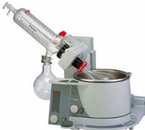
Photo d'un évaporateur rotatif

Le solvant est donc éliminé par évaporation à basse température sous pression réduite . Les vapeurs de solvant sont liquéfiées grâce au réfrigérant . Le solvant liquide est recueilli dans un ballon réceptacle . Ce solvant peut être ré-utilisé en théorie. Cependant en pratique, si le vide a été généré par une trompe à eau, il est saturé en eau ! Il convient donc d'éliminer cette eau avant de ré-utiliser le solvant .